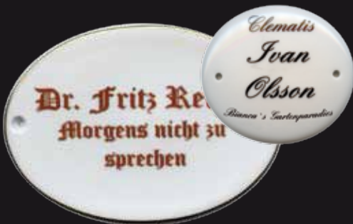
Türschilder, Wandplatten, Fliesenbilder Rosen und Kräuterschilder für den Garten