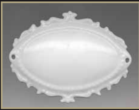
2040 we Türschild Barock mit Loch L 2 x B 15 x H 11 cm