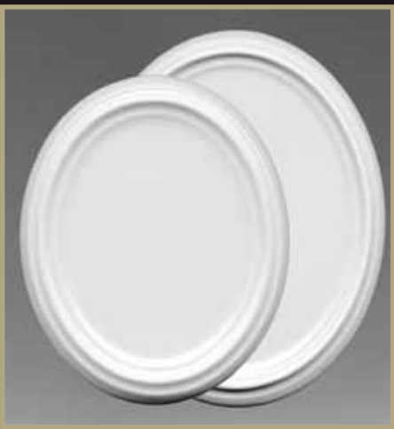
1236 we 1237 we Medaillon Medaillon L 11,5 x B 9,5 x H 1 cm L 17 x B 14 x H 1,5 cm