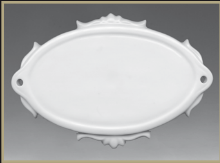
2041 we Türschild Relief mit Loch L 1,5 x B 15 x H 10 cm